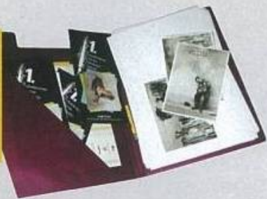
* Dosja me fieta e kartolina spirit. The file with humorous sheets and postcards