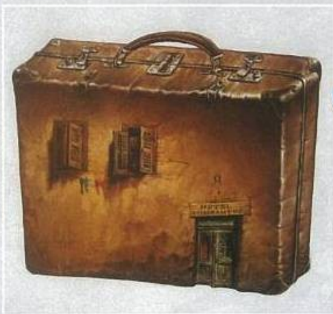
* Vepra "Immigration", fituese e çmimit Grand Prix, Itali 2009. The work Immigration, winner of Grand Prix Prize, Italy 2009