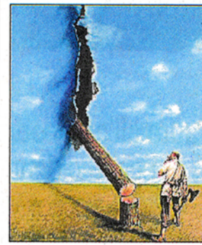
La vignetta vincitrice