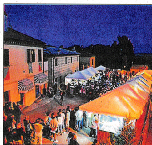
Il borgo di Candelara si anima con la manifestazione dedicata alle antiche arti e mestieri

prese con una performance di percussioni con ritmi brasiliani. Si susseguiranno poi i Ballfolk e alle 20.30 sarà la volta del gruppo pesarese gli Amici della Musica . In cartellone sono previsti anche gli Overcast e i Garuda . Il Teatro dei Bottoni propone la commedia "Heroes: la felicità sta oltre l'orizzonte". A chiudere il panorama musicale sarà l'orchestra spettacolo Bergamini . E mentre nell'aria riecheggia la musica, si potrà ammirare lungo le strade il lavoro di veri maestri nell'arte orafa, ma anche nella lavorazione del rame, nella realizzazione di coltelli ed esperti nella forgiatura e di arte orafa. Sarà possibile osservare da vicino il loro lavoro, ricordando quello di un altro artista scomparso da poco: Giovanni Gentiletti di Candelara.