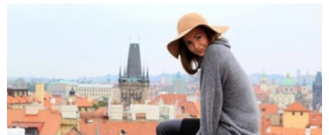
Vizitoi 50 shtete pa asnjë kacidhe