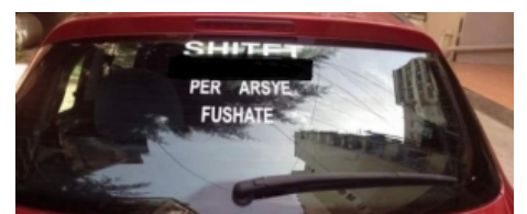
FOTOLAJM/ Shes makinën për arsye fushate