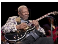
Shuhet legjenda e muzikës Blues