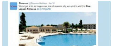
Shkojnë me pushime në Greqi, por hoteli ishte ende në ndërtim