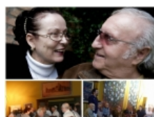
"Nuk e di nëse e meritoj titullin 'Epoka