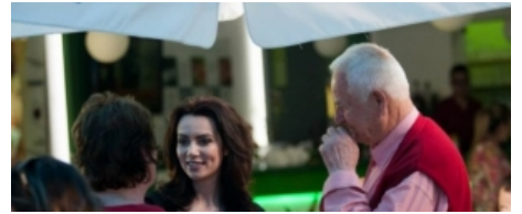
FOTOLAJM/ Kur Grida Duma "provokon" durrsakët