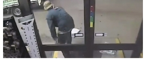
A ka grabitës më idiot se ky? (VIDEO)