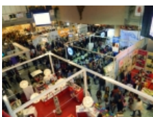
Përkundër Panairit të Librit, vizitorët